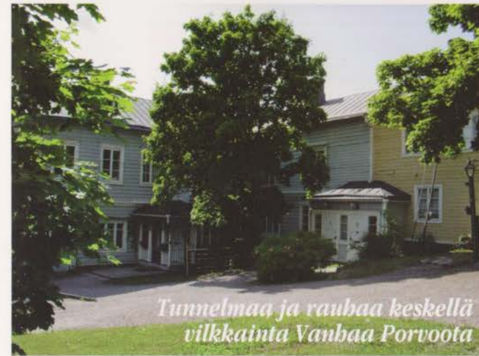
Tunnelmaa ja rauhaa keskellä vilkkainta Vanhaa Porvoota