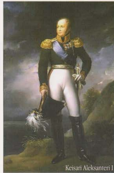
Keisari Aleksanteri I